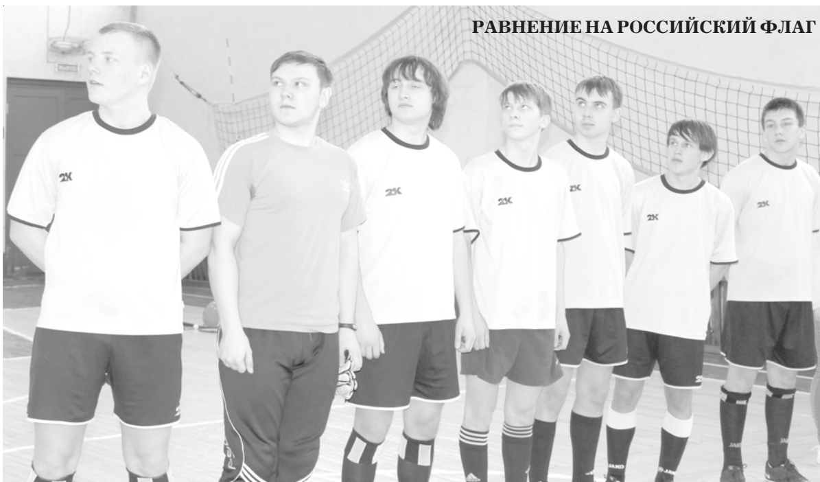
РАВНЕНИЕ НА РОССИЙСКИЙ ФЛАГ

Очень хочется надеяться, что спартакиада между поселениями станет традиционной, и хотелось бы видеть в ней среди участников и команду администрации муниципального района. Можно с полной уверенностью говорить о том, что спорт способствует не только поддерживать хоро-