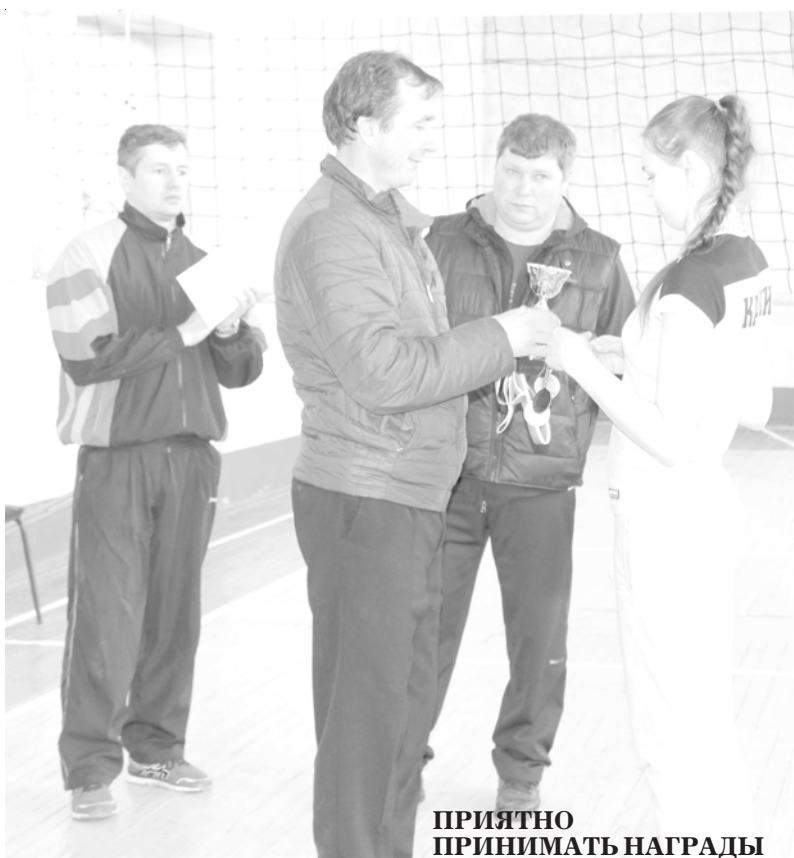
ПРИЯТНО ПРИНИМАТЬ НАГРАДЫ

Острыми и зрелищными получились все матчи по футболу и волейболу. Каждая команда показала, что это