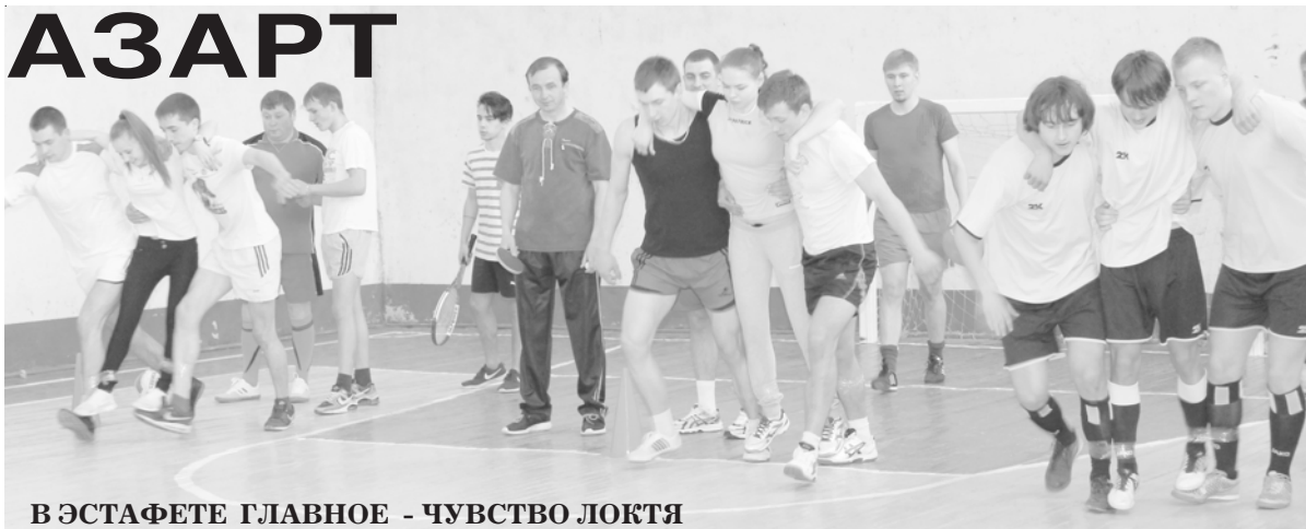
В ЭСТАФЕТЕ ГЛАВНОЕ - ЧУВСТВО ЛОКТА

действительно КОМАНДА, а не просто собравшиеся вместе люди. К победе стремился каждый, играли с полной отдачей, но и каждый переживал и радовался за победу коллег. Не зависти, не злости, не возмущения – хотя острых моментов хватало на всё протяжении спартакиады.